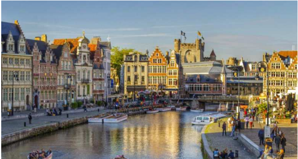
La città di Gent