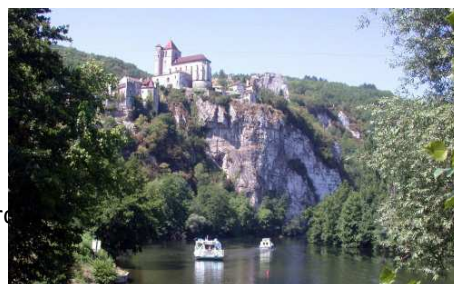
Saint Cirac Lapopie